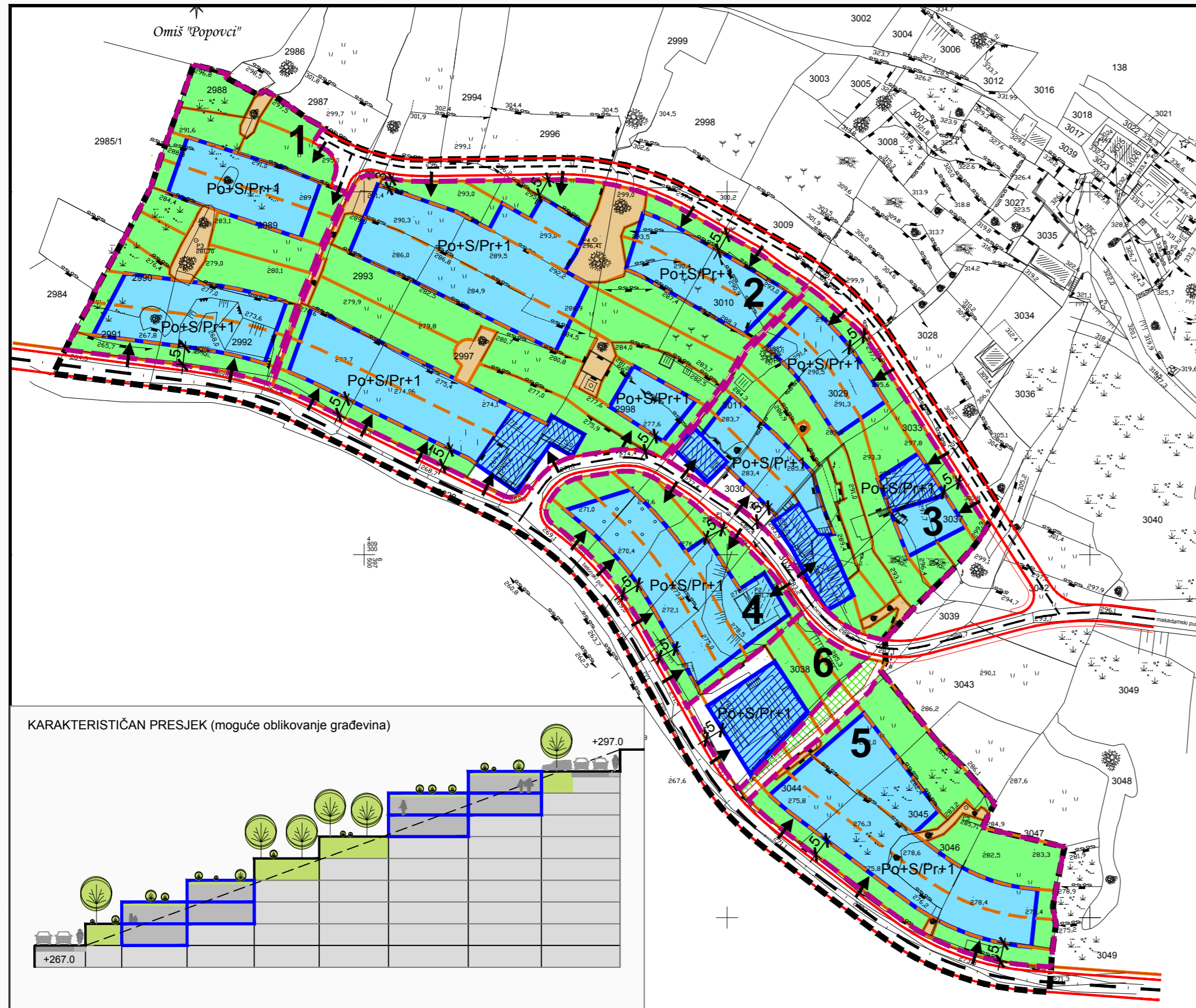
KARAKTERISTIČAN PRESJEK (moguće oblikovanje građevina)