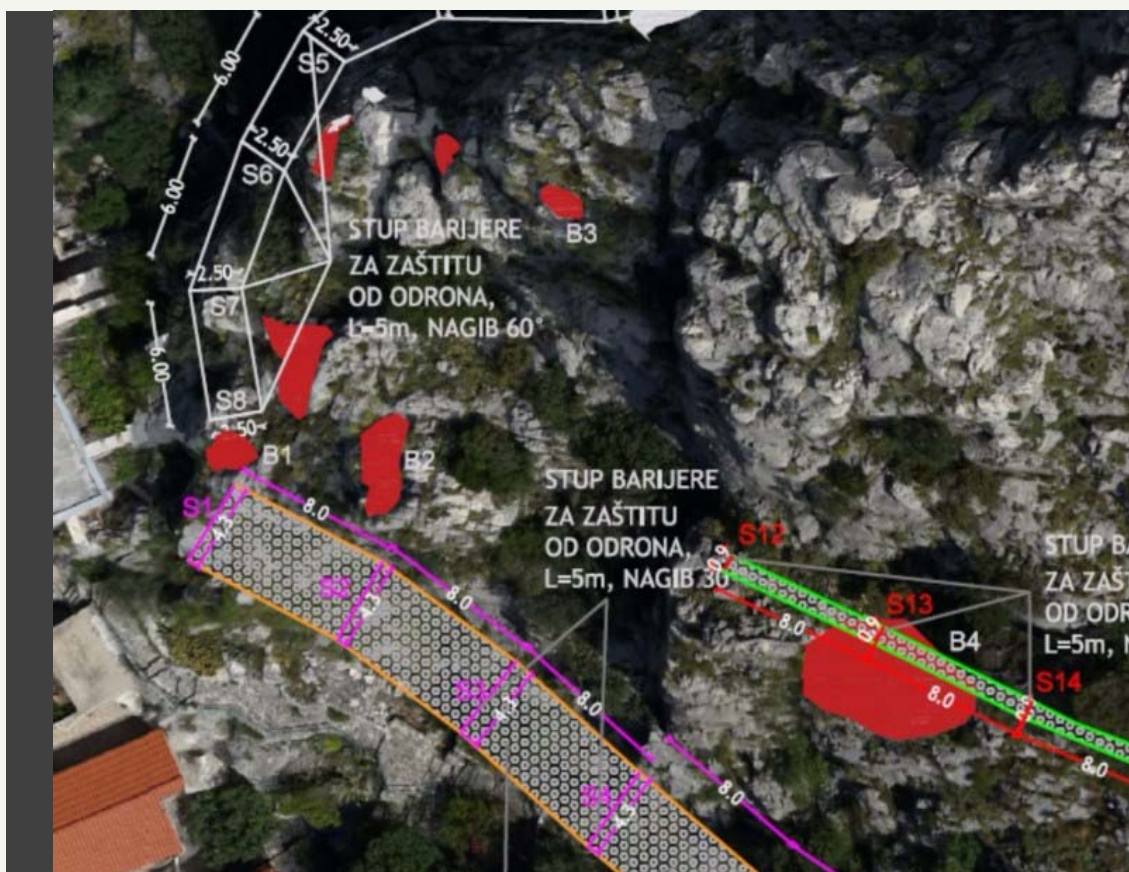
MIKROLOKACIJE 15 i 16