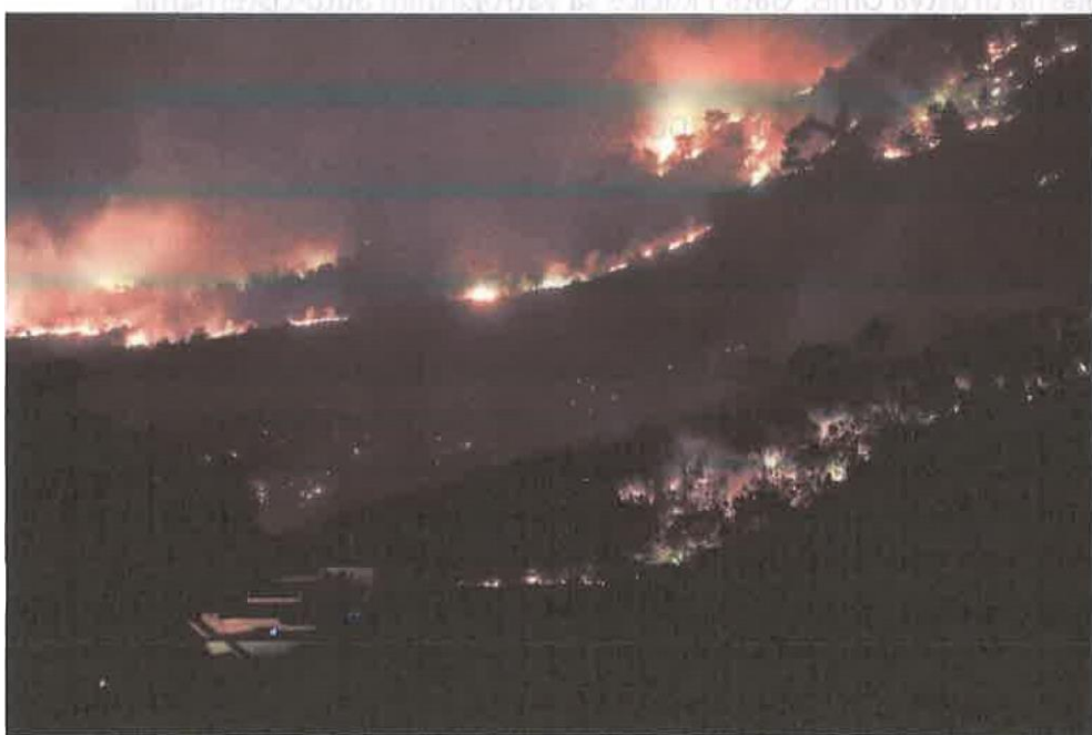
Slika s požara iz Lokve Rogoznice 10.01.2022.

Sudjelovali smo i kao ispomoć na većim požarima diljem naše Županije: Trogir-Marina, Brač, Hvar, Makarska, Tučepi, Imotski.