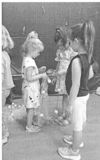
Posjetitelji iz Dječjeg vrtića Omiš pletu mrežu