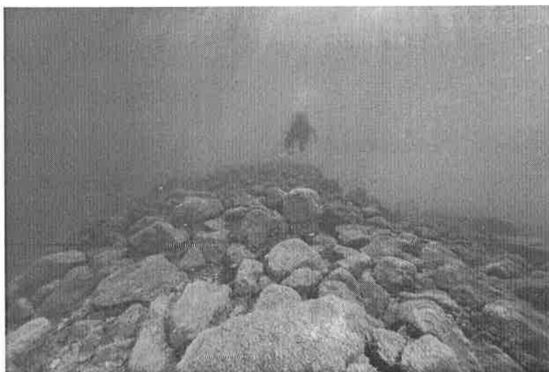
Dokumentiranje Mostine, listopad 2022.

bilo bi važno paralelno s istraživanjem kaštela nastaviti i ovaj projekt dokumentiranja i istraživanja Mostine koja je bila važan faktor u sustavu obrane omiškog srednjovjekovnog grada s morske strane. Prema preliminarnim podacima ovogodišnje kampanje riječ je o suhozidnom nasipu koji se pruža dnom ušća u smjeru SI – JZ, s tim da se uz lijevu obalu rijeke gubi. Dužine je oko 130 m, a najveća izmjerena visina je 8 m s morske strane, dok je sa sjeverne strane visok 4 – 5 m. Vjerojatno je ta razlika nastala zbog nanosa riječnog mulja i kamenja koje se zadržalo s kopnene strane nasipa. U tom slučaju možemo očekivati i postojanje kulturnih slojeva, što bi se otklonilo ili potvrdilo jedino provedbom sistematskih arheoloških istraživanja korita rijeke.