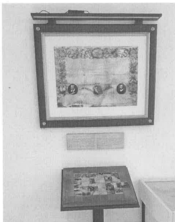
Izložena replika omiške dukale i slagalice istog motiva