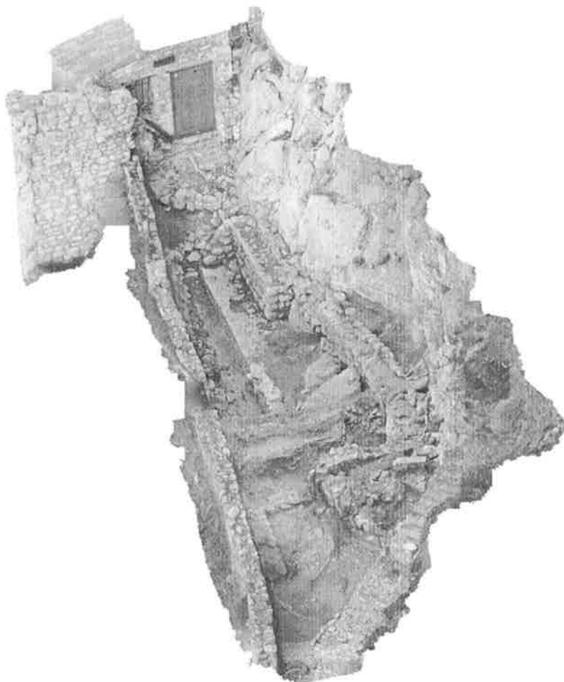
Arheološka istraživanja na prvom platou kaštela; 3d model (Arheorad j.d.o.o.)

groblje na redove 4 . Sve ove činjenice nas upućuju na važnost provedbe istražnih radova kako bi se cjelokupna povijesna zbilja i stručno utemeljila.