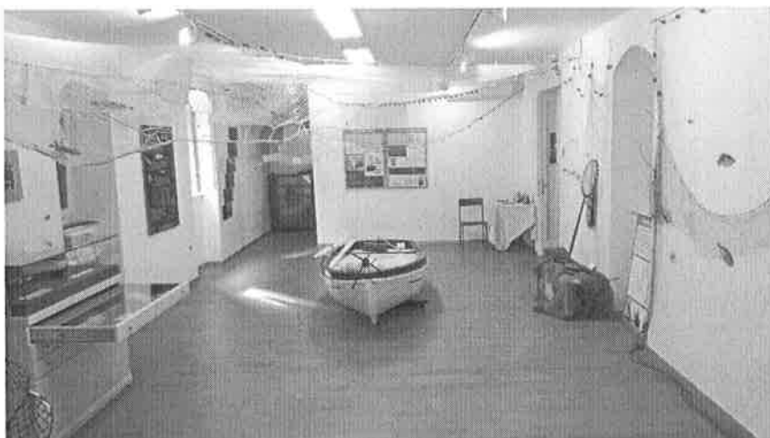
Izložba Raznolikost morskih ribolovnih alata u Hrvata, GMO