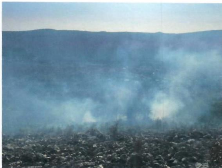
Slike s intervencija udara groma u crkvu u Trnbusima i požar u Srinjinama

Moramo istaći da smo na vatrogasnim intervencijama i tijekom ovog razdoblja imali odličnu suradnju naših vatrogasnih postrojbi s požarnog područja, te ostalim učesnicima van našeg područja djelovanja, vatrogasnim operativnim centrom (193), Centrom zaštite i spašavanja (112) i zračnim snagama iz Zemunika.