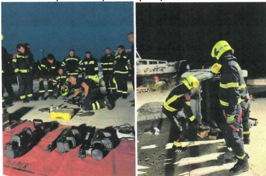
Slike s tečaja Weber rescue systems

U organizaciji Hrvatske vatrogasne zajednice 2 naša člana su položila ispit za navođenje protupožarnih zrakoplova, a 14 članova je završilo obuku za spašavanje na visinama i u dubinama. U organizaciji s proizvođačem hidrauličke opreme Weber rescue systems, 18 naših članova je završilo njihov tečaj za upotrebu hidrauličkih alata.