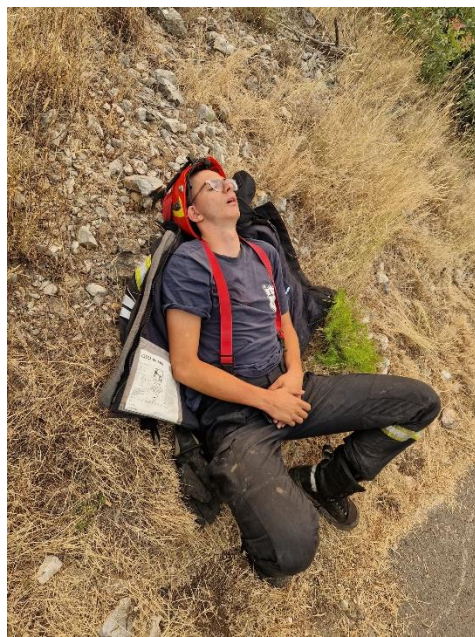
Slike: Vatrogasaci nakon 16 sati neprekidne borbe s vatrenom stihijom u Tučepima

Požara otvorenog prostora je bilo 87 , za koje se uglavnom pretpostavlja da ih je prouzrokovao čovjek, (najčešće je riječ o nesmotrenom spaljivanju biljnog otpada), uz tehničke i klimatske uvjete koji su pogodovali nastanku i širenju požara.