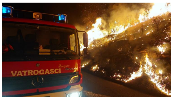
Slike s intervencija u Žrnovnici