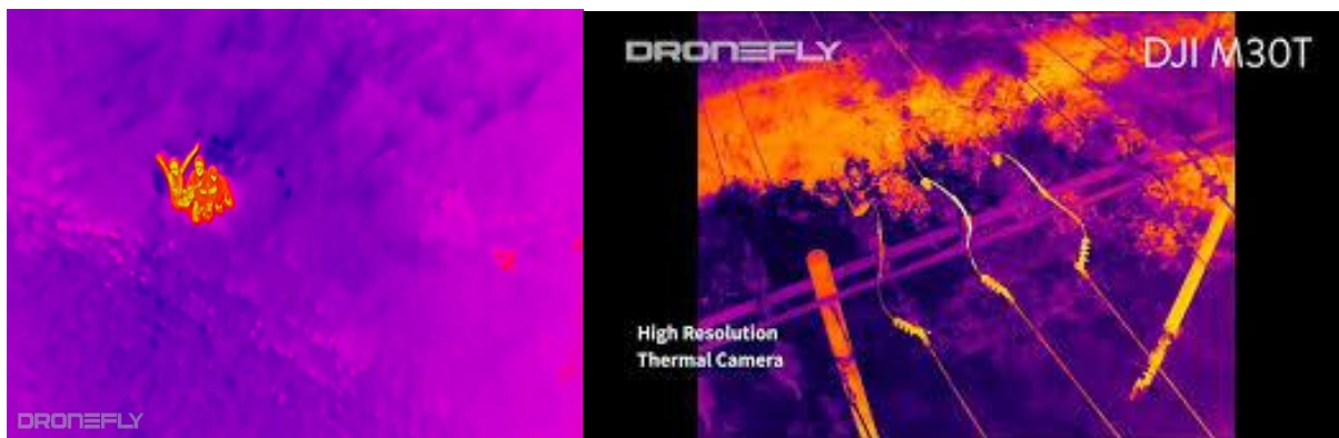
Slike termalne kamere Drona DJI Matrice 30t prilikom potrage i požara

Kupljeno je 14 dvodijelnih odijela za šumske požare. Odijela su izrađena od Nomexa, rip-stop materijala. Kupljeno je 15 pari čizama za vatrogasne intervencije, te veći broj sitne vatrogasne opreme (potkape, rukavice,...).