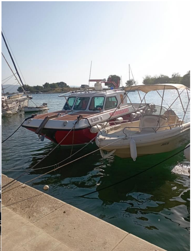
Slike vatrogasnog broda DVD-a Omiš

Na svim vozilima Dobrovoljnih vatrogasnih društava Omiša, Gata i Kučića, kao i VZG Omiša, obavljen je pregled, servisi vozila, izvršeni su popravci, kao i neke male prenamjene na vatrogasnim nadogradnjama, gdje je uočena potreba za istima.