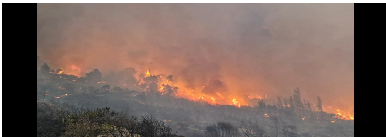
Slika s požara u Tučepima

Vatrogasne postrojbe na području Grada Omiša tijekom prvih 9 mjeseci 2024. godine imale su 320 vatrogasne intervencije. Iako je zbog nepovoljnih vremenskih uvjeta bio očekivan velik broj požara otvorenog prostora, u prvih 6 mjeseci do istih nije došlo. U 3. kvartalu 2024. godine na našem području također nije bilo velikih požara otvorenog prostora, ali su sve naše snage sudjelovale na svim velikim požarima unutar naše županije.