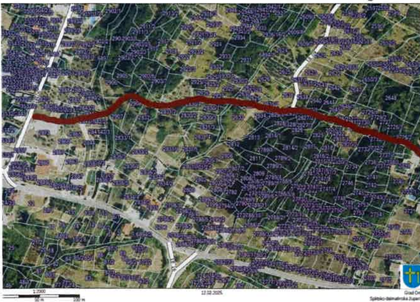
Nerazvrstana cesta 18_08