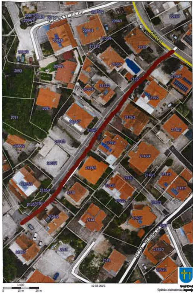
GRAFIČKI PRILOG 5 — Nerazvrstana cesta 03_03 Nemira V