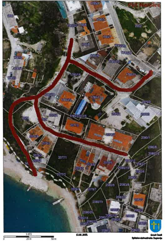
GRAFIČKI PRILOG 3 — Nerazvrstana cesta 03_01