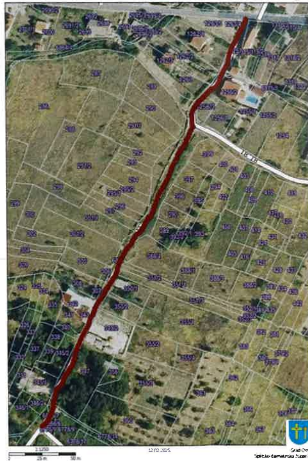
Nerazvrstana cesta 18_08