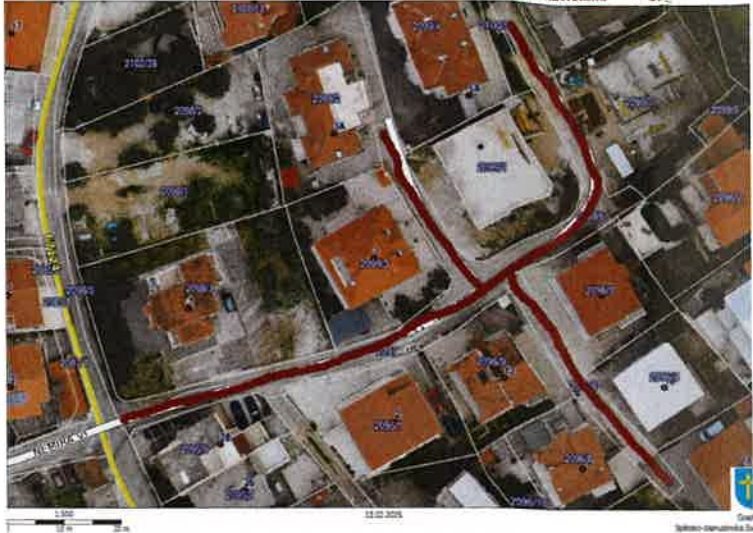
Nerazvrstana cesta 03_11 Nemira X