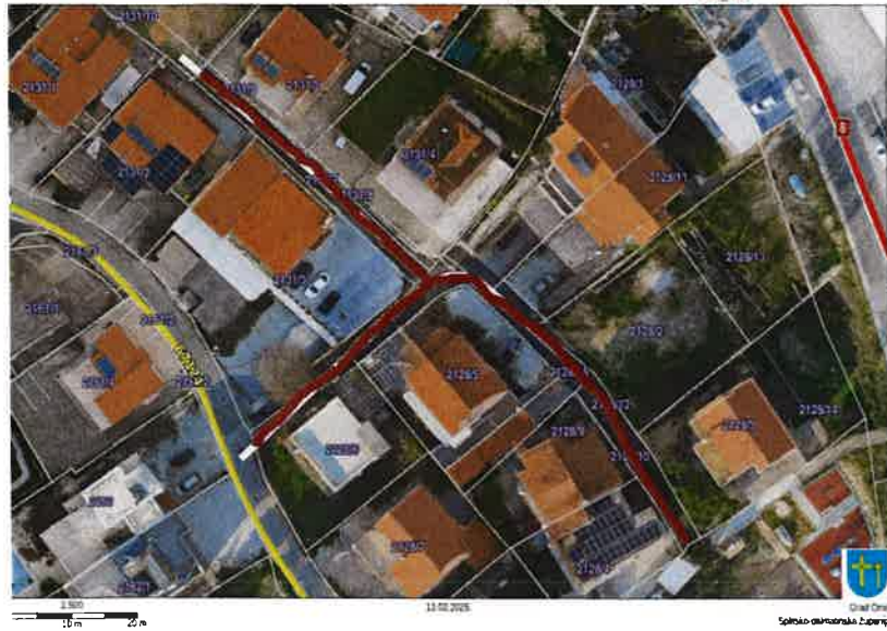
Nerazvrstana cesta 03_12 Nemira XI