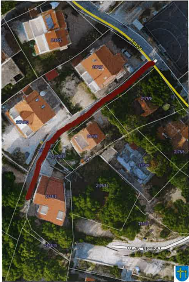
GRAFIČKI PRIKAZ 6 Nerazvrstana cesta 03_05 Nemira V