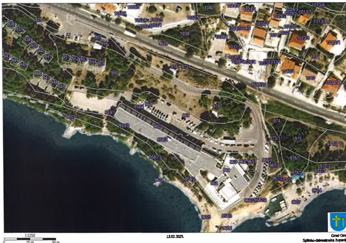
Digitalni ortofoto 2011. g.