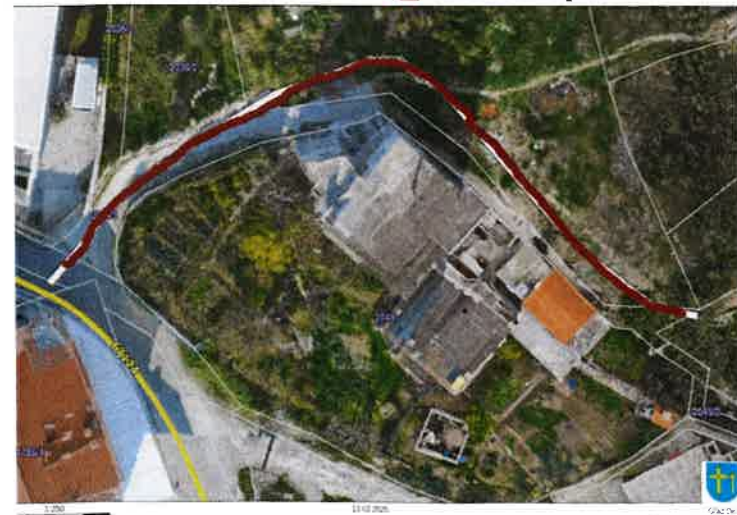
Nerazvrstana cesta 03_16 Put Nemire