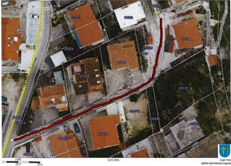
Nerazvrstana cesta 03_10 Nemira IX