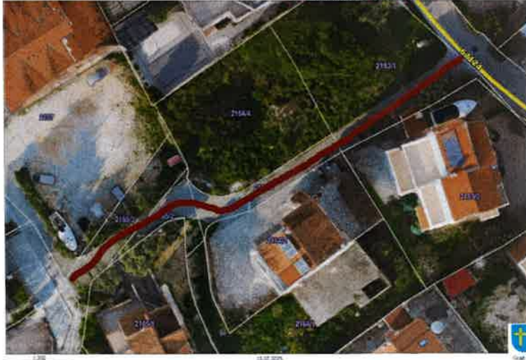
Nerazvrstana cesta 03_17 Nemira III