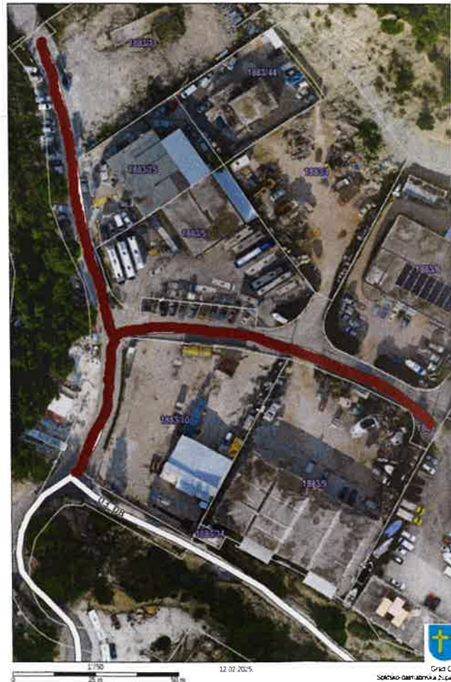
GRAFIČKI PRILOG 8 Nerazvrstana cesta 03_07 Vrisovci