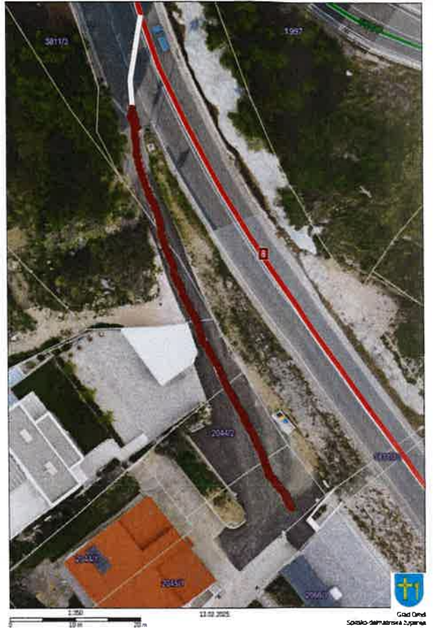
Nerazvrstana cesta 03_15 Put Nemira