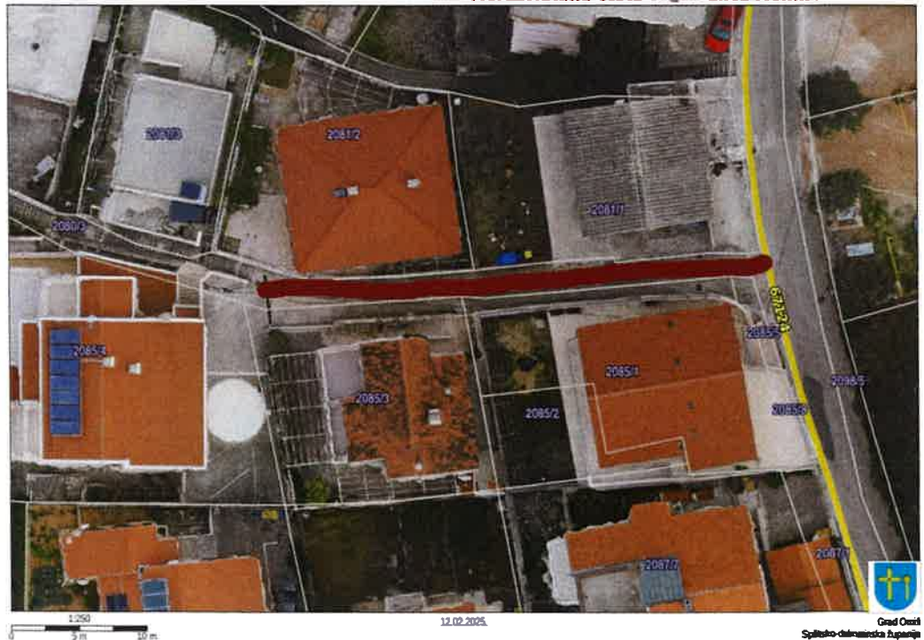
— Nerazvrstana cesta 03_02 ulica Nemira VII